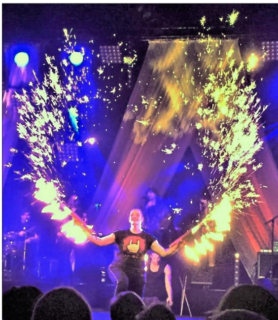
Die Feuershow war ein absoluter Hingucker.