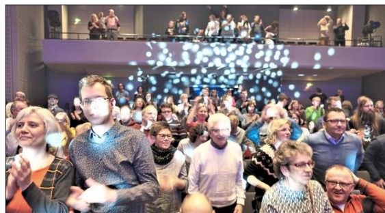
Am Ende gab es stehende Ovationen für die Künstler.